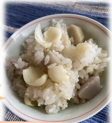
里芋とゆり根のごはん