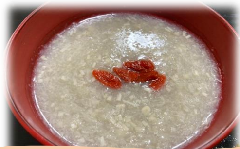
れんこんおろしスープ